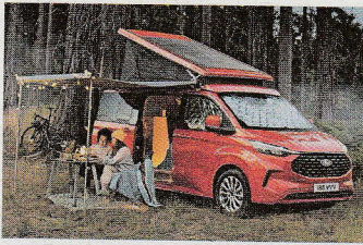
Le Westfalia Nugget de Ford se présente sous la forme d'un hybride rechargeable.

Pour les personnes intéressées à posséder un camping-car mais souhaitant conserver leur garage, il existe des modèles chez le représentant de la marque. Le dénominateur commun: ils sont encore relativement compacts et surtout adaptés aux parkings souterrains.