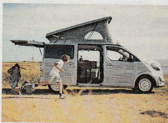
Le Citroën Type Holidays est unique du côté du design.

ra également des portes coulissantes et sera disponible en hybride rechargeable respectueux de l'environnement.